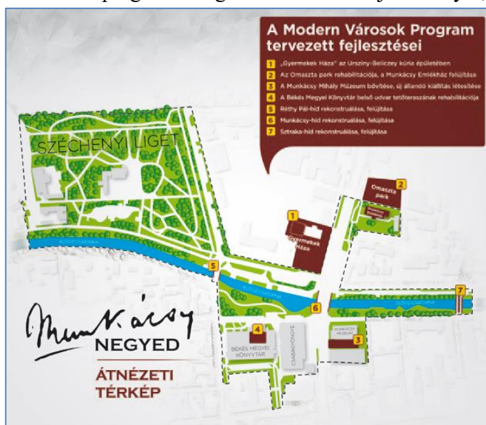
3. ábra A Munkácsy Negyed fizikai lehatárolása

Munkácsy Emlékház – szoborsétány – Munkácsy Mihály Múzeum – Csabagyöngye Kulturális Központ – Békés Megyei Könyvtár – Aradi vértanúk ligete – Széchenyi liget – Munkácsy Hotel – István malom – Gőzmalom tér – Ursziny-Beliczey kúria