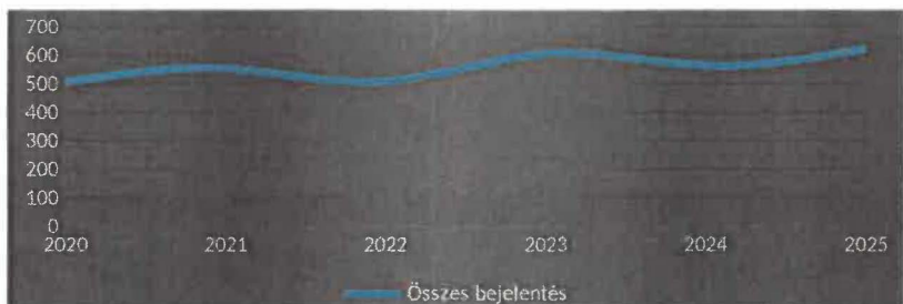
Bejelentések száma 2020-2025

Az elmúlt évhez képest nőtt a bejelentések száma. A megyei jogú város közigazgatási területéről 2025-ben 623 jelzés érkezett, 58-cal több, mint az előző évben.